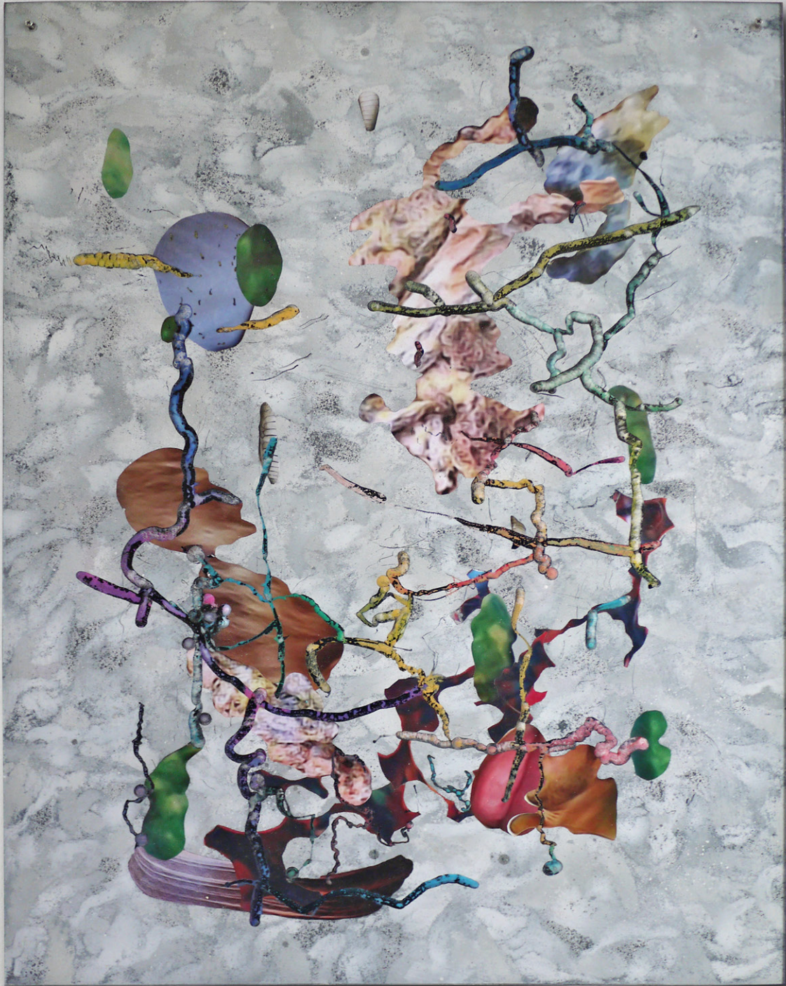
David de Tscherner, Planche XVI (Schaerbeek) , 2016 Techniques mixtes sur Plexiglass / Mixed media on Plexiglass 100 x 75 cm. Unique