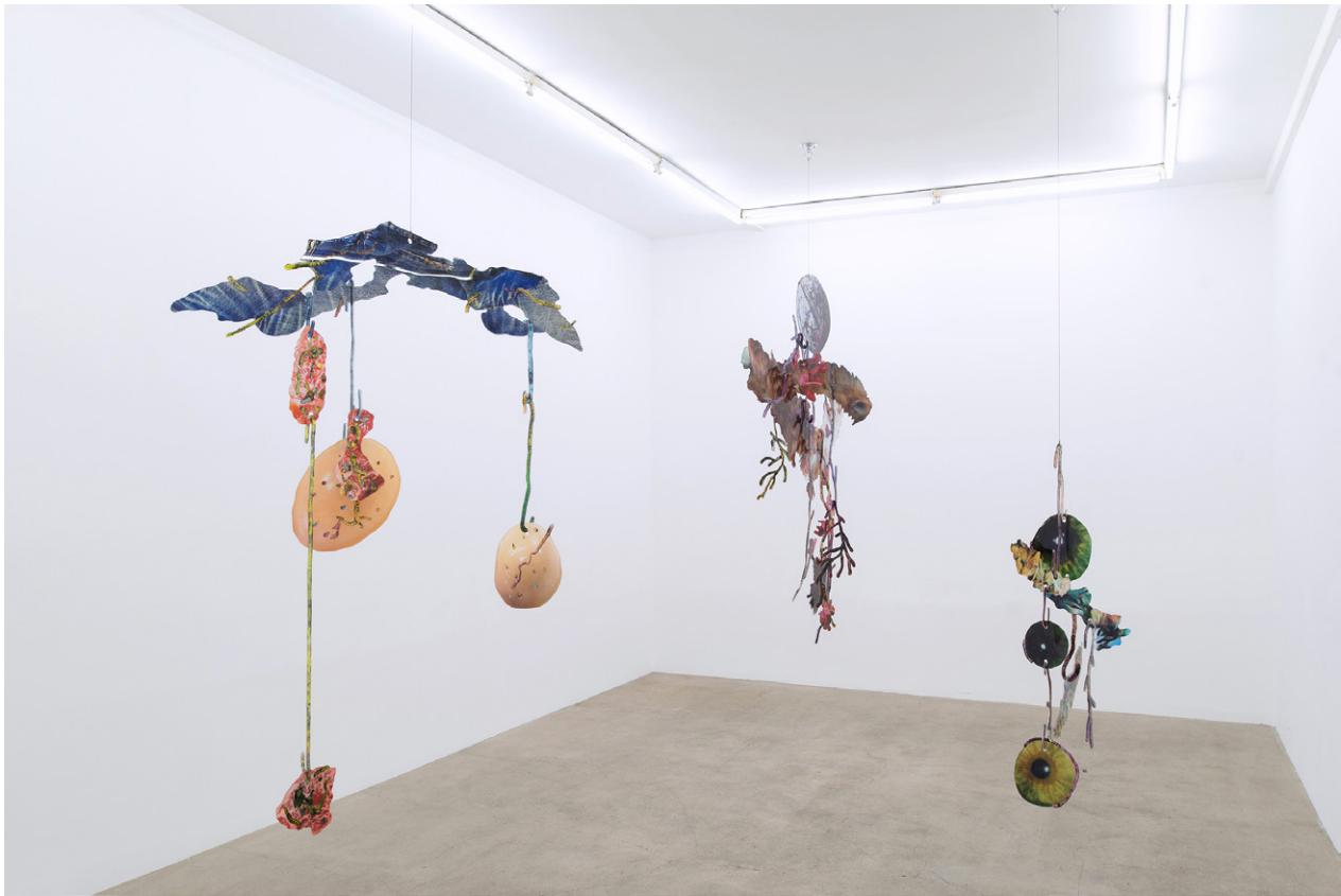
Vue d'exposition, Les Ambassadeurs – David de Tschärner / Exhibition view, Les Ambassadeurs – David de Tschärner Galerie Escougnou-Cetraro, Paris