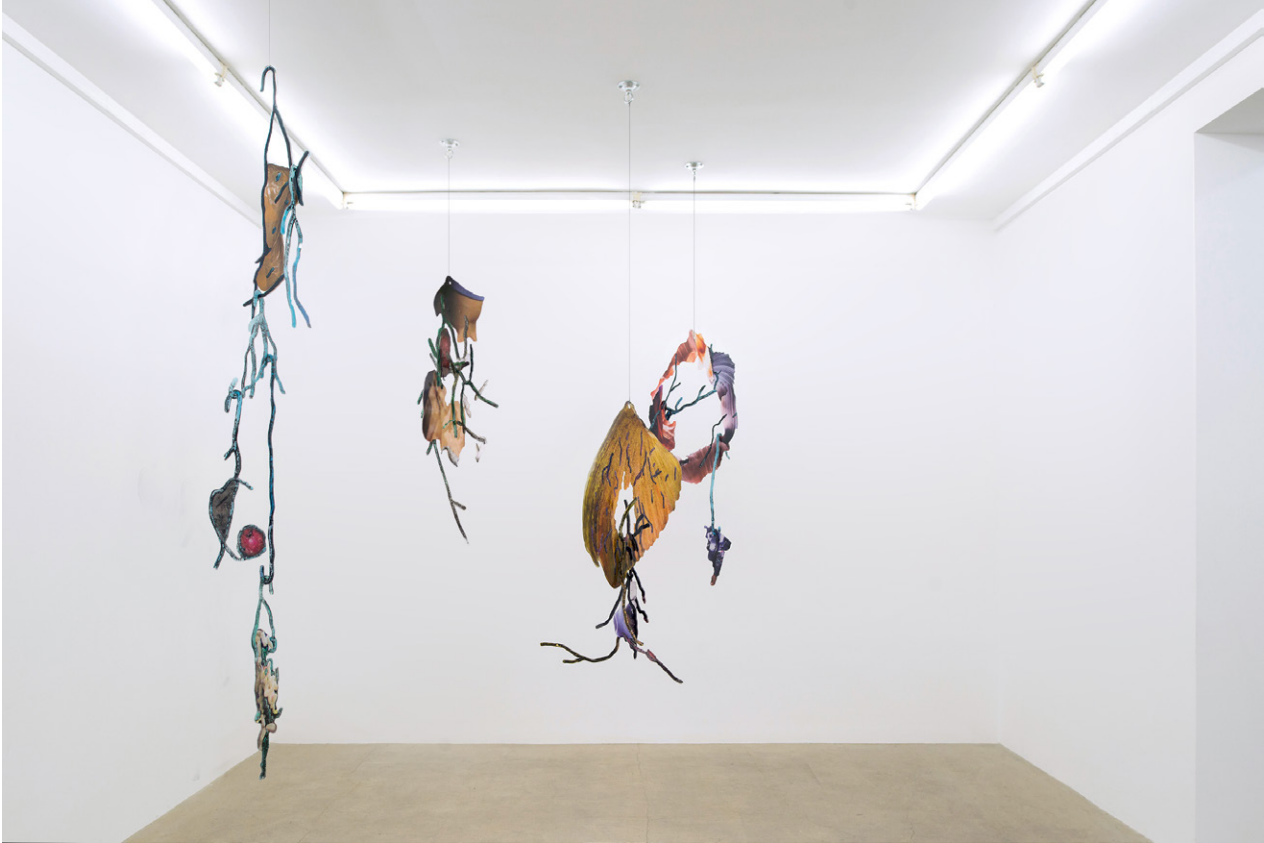
Vue d'exposition, Les Ambassadeurs – David de Tscharner / Exhibition view, Les Ambassadeurs – David de Tscharner Galerie Escougnou-Cetraro, Paris