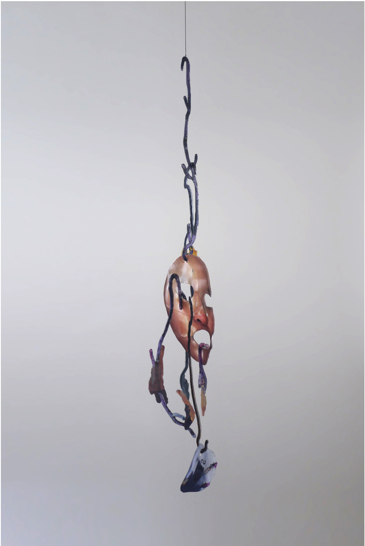
David de Tschärner, Ambassadeur I , 2016 Techniques mixtes sur Plexiglass / Mixed media on Plexiglass 183 x 34 x 24 cm. Unique