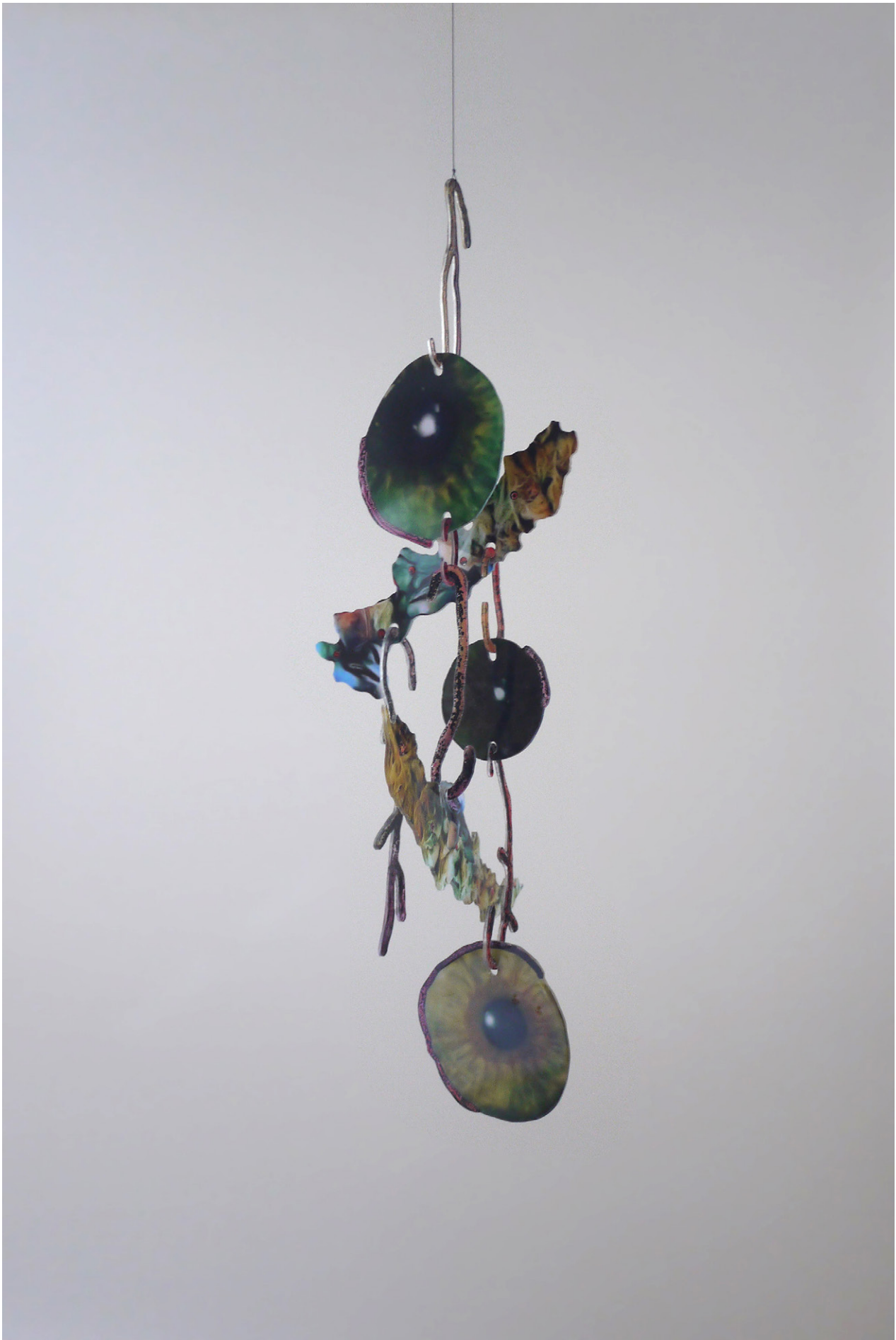
David de Tscherner, Ambassadeur IX , 2016 Techniques mixtes sur Plexiglass / Mixed media on Plexiglass 125 x 38 x 45 cm. Unique