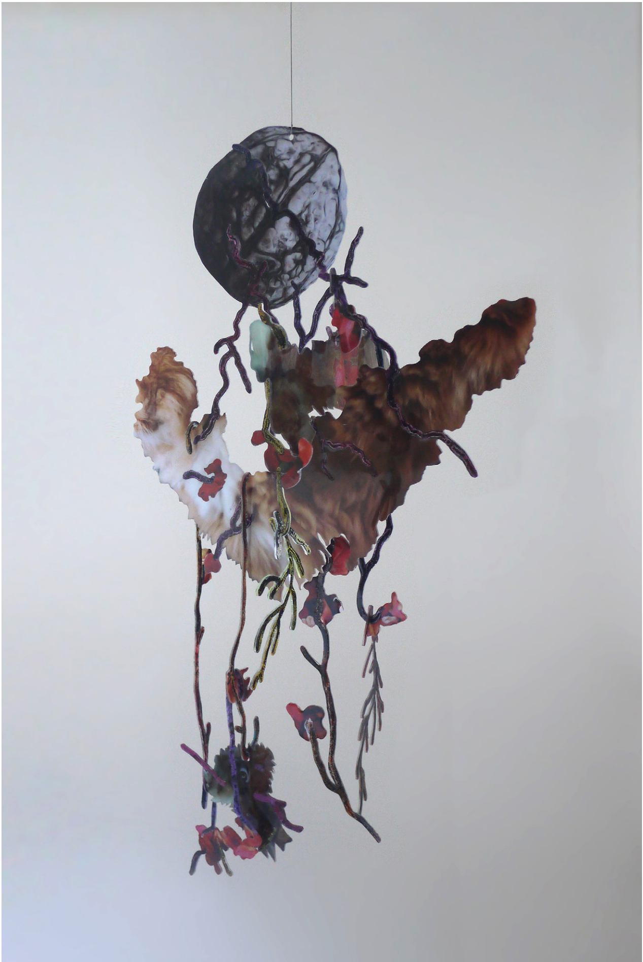
David de Tscherner, Ambassadeur VII , 2016 Techniques mixtes sur Plexiglass / Mixed media on Plexiglass 193 x 98 x 77 cm. Unique