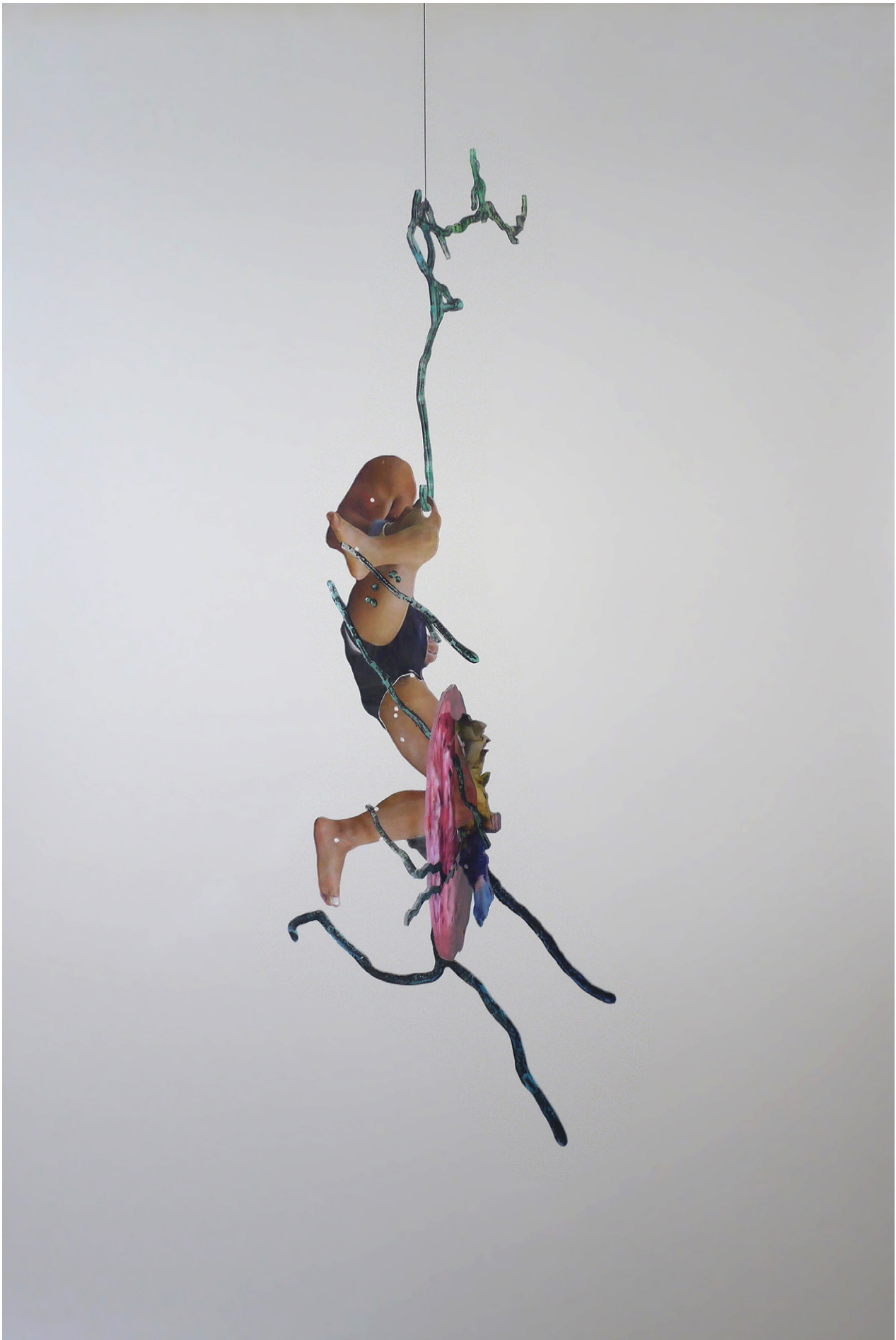
David de Tscherner, Ambassadeur IV , 2016 Techniques mixtes sur Plexiglass / Mixed media on Plexiglass 145 x 59 x 44 cm. Unique