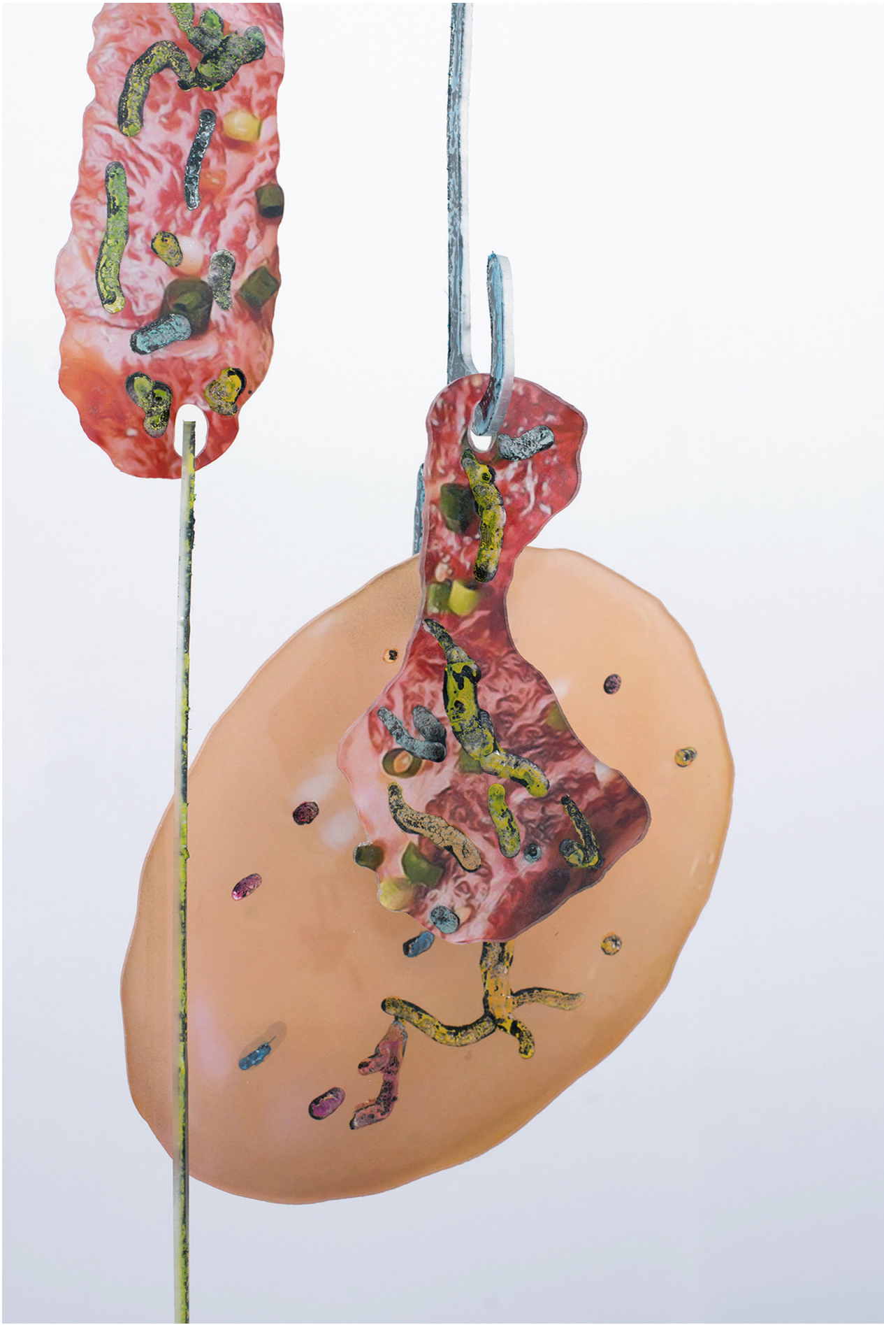
David de Tscharnier, Ambassadeur V , 2016. Detail Techniques mixtes sur Plexiglas / Mixed media on Plexiglass 158 x 121 x 26 cm