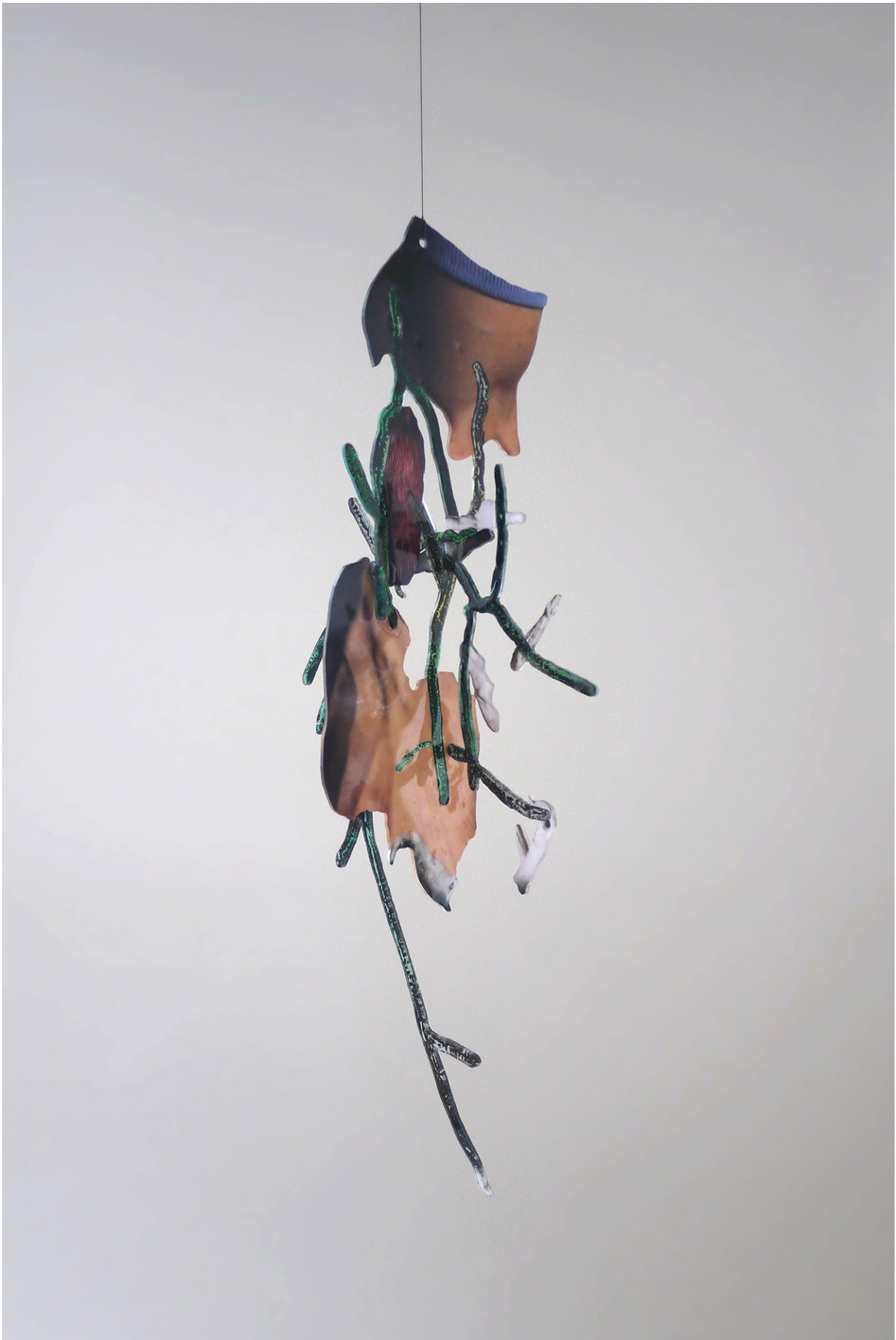
David de Tschärner, Ambassadeur III , 2016 Techniques mixtes sur Plexiglass / Mixed media on Plexiglass 115 x 34 x 48 cm. Unique