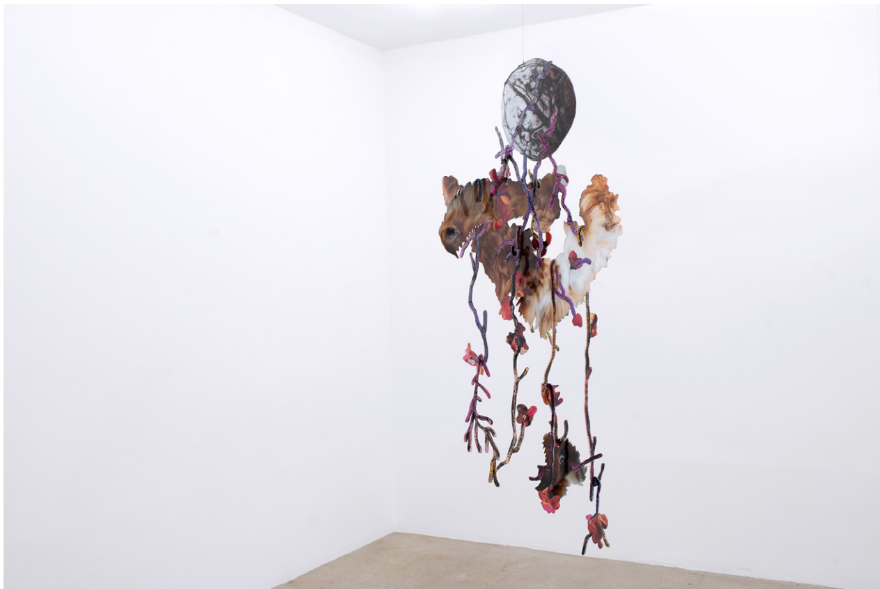
David de Tschärner, Ambassadeur VII , 2016 Techniques mixtes sur Plexiglas / Mixed media on Plexiglass 193 x 98 x 77 cm