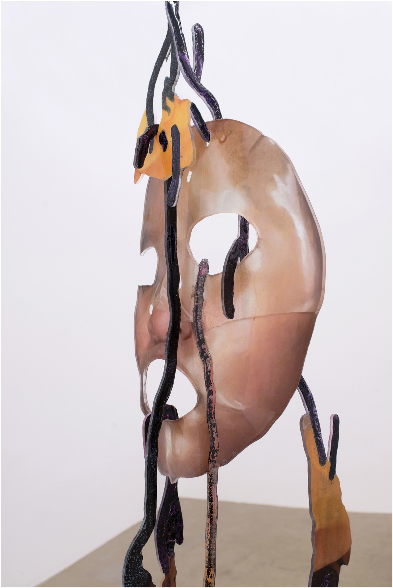
David de Tschärner, Ambassadeur I , 2016. Détail Techniques mixtes sur Plexiglas / Mixed media on Plexiglass 183 x 34 x 24 cm