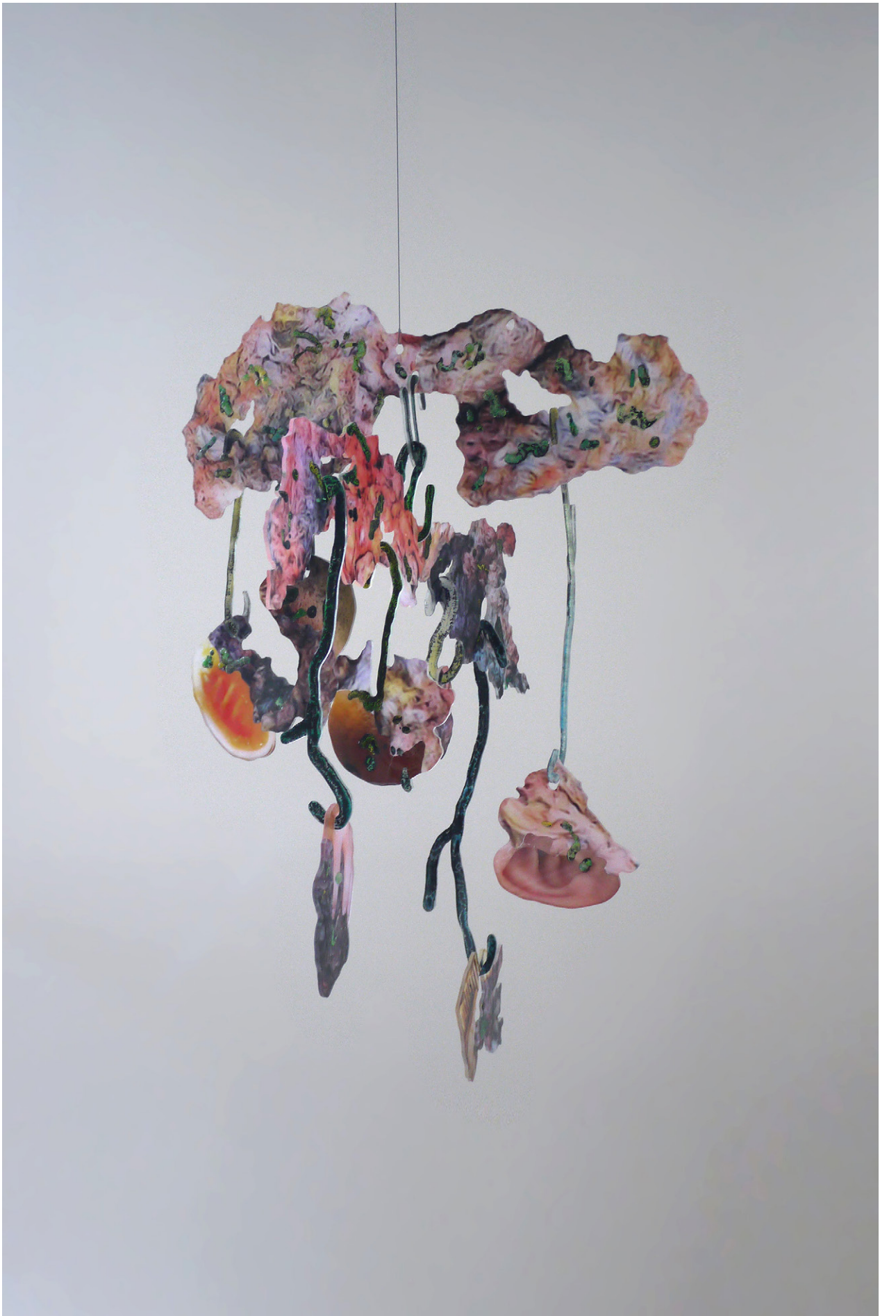
David de Tschärner, Ambassadeur VIII , 2016 Techniques mixtes sur Plexiglass / Mixed media on Plexiglass 110 x 75 x 75. Unique