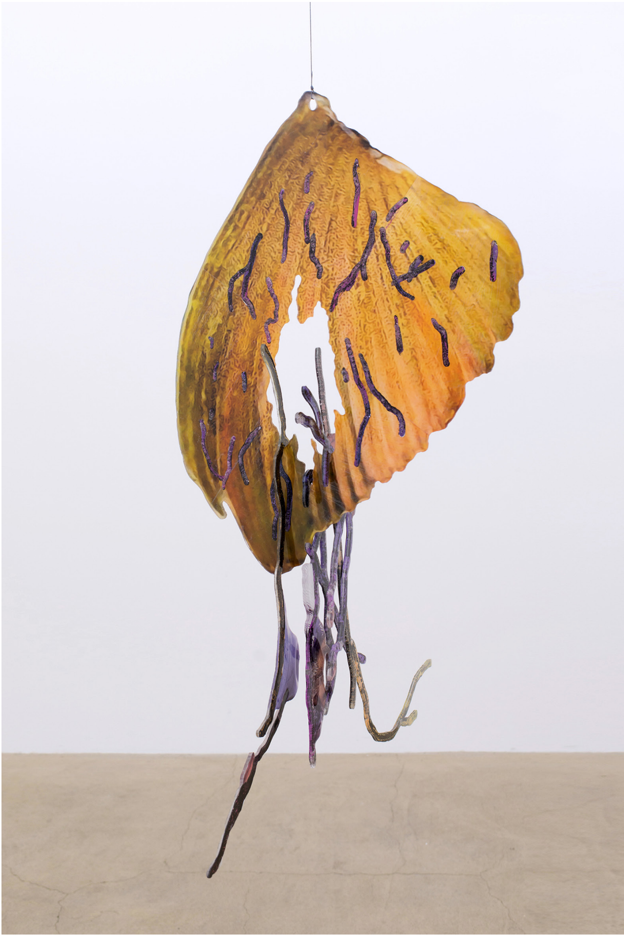
David de Tschärner, Ambassadeur II , 2016 Techniques mixtes sur Plexiglas / Mixed media on Plexiglass 113 x 59 x 90 cm