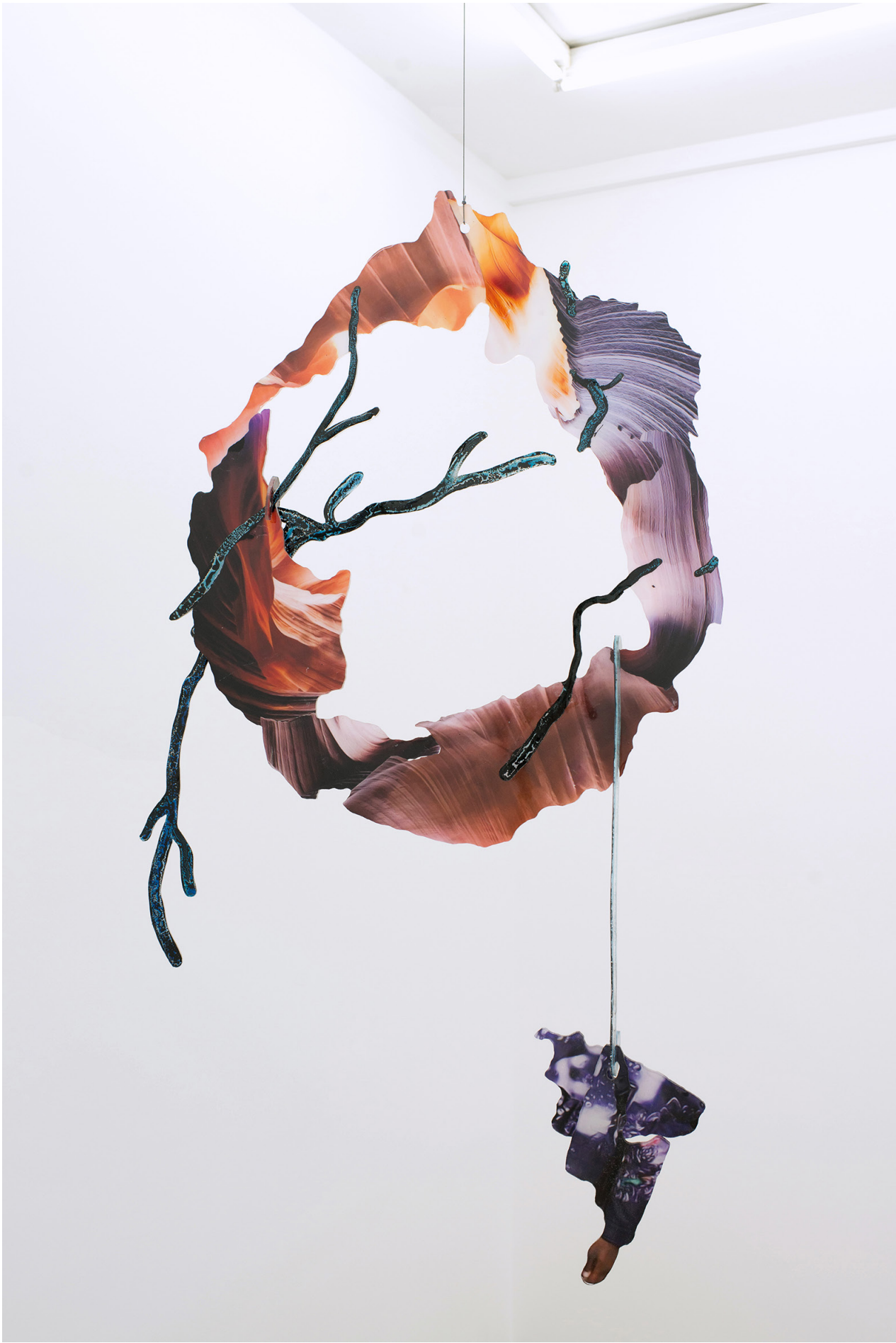
David de Tschärner, Ambassadeur VI , 2016 Techniques mixtes sur Plexiglas / Mixed media on Plexiglass 128 x 68 x 12 cm