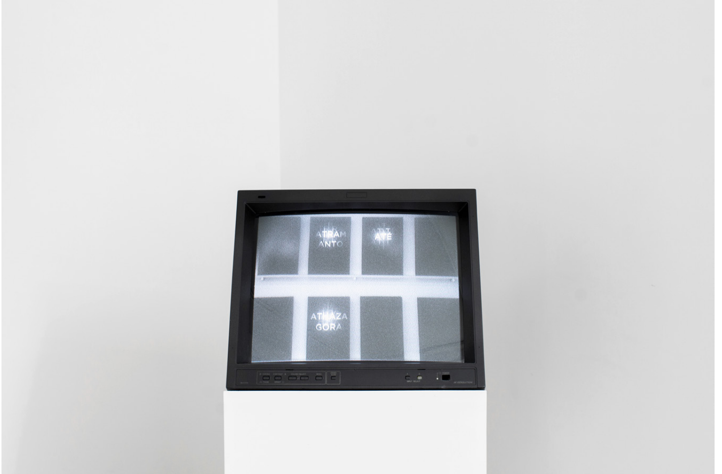
Vue d'exposition / Exhibition view « Emmanuel Le Cerf – I keep hell clean for your return », Galerie Escougnou-Cetraro, Paris