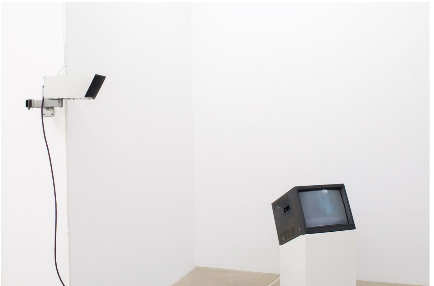
Vue d'exposition / Exhibition view « Emmanuel Le Cerf – I keep hell clean for your return », Galerie Escougnou-Cetraro, Paris