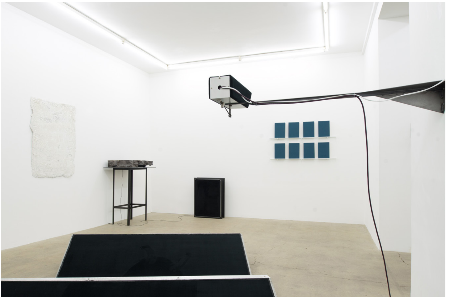
Vue d'exposition / Exhibition view « Emmanuel Le Cerf – I keep hell clean for your return », Galerie Escougnou-Cetraro, Paris