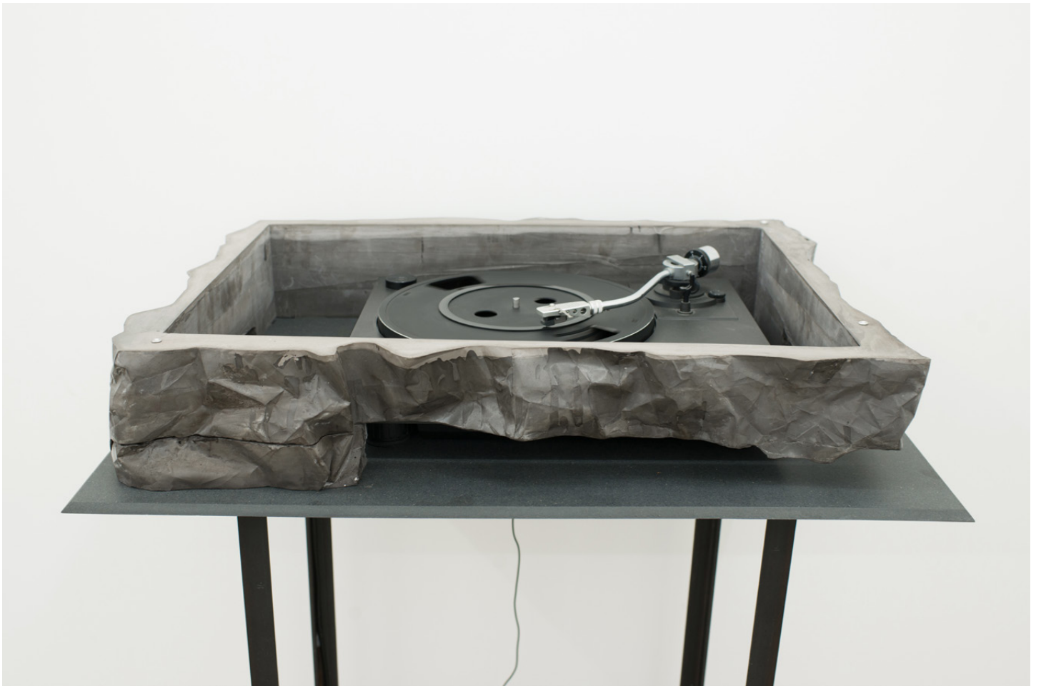
Vue d'exposition / Exhibition view « Emmanuel Le Cerf – I keep hell clean for your return », Galerie Escougnou-Cetraro, Paris