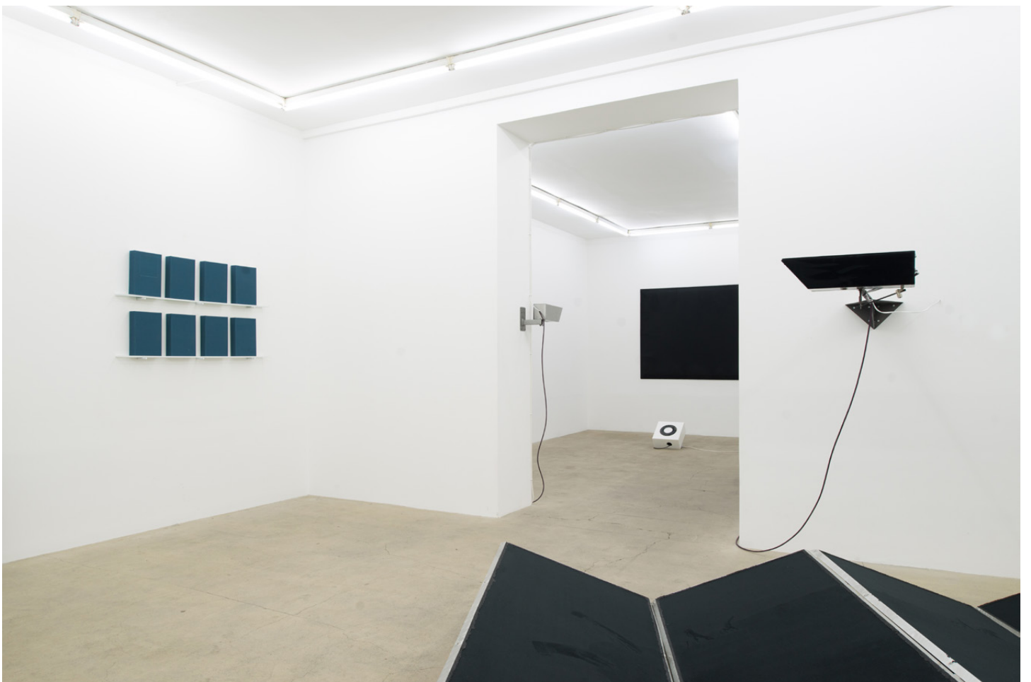
Vue d'exposition / Exhibition view « Emmanuel Le Cerf – I keep hell clean for your return », Galerie Escougnou-Cetraro, Paris