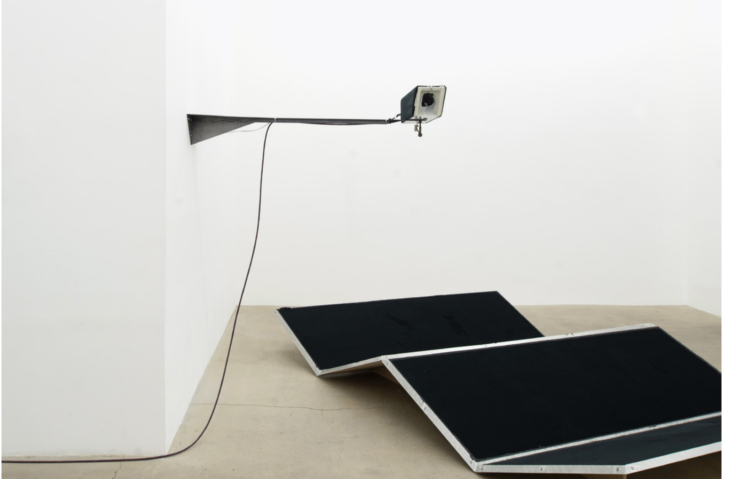
Vue d'exposition / Exhibition view « Emmanuel Le Cerf – I keep hell clean for your return », Galerie Escougnou-Cetraro, Paris