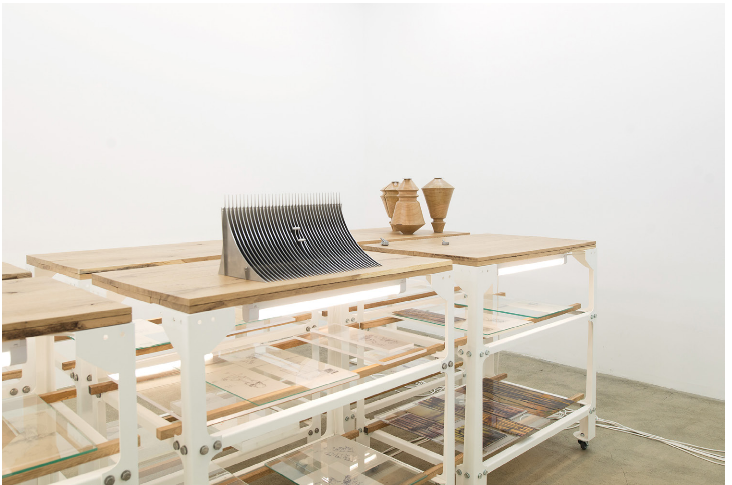
Vue de l'exposition de Florian Sumi / Overview of the exhibition « Florian Sumi : Maître Cœur ». Galerie Escougnou-Cetraro, Paris