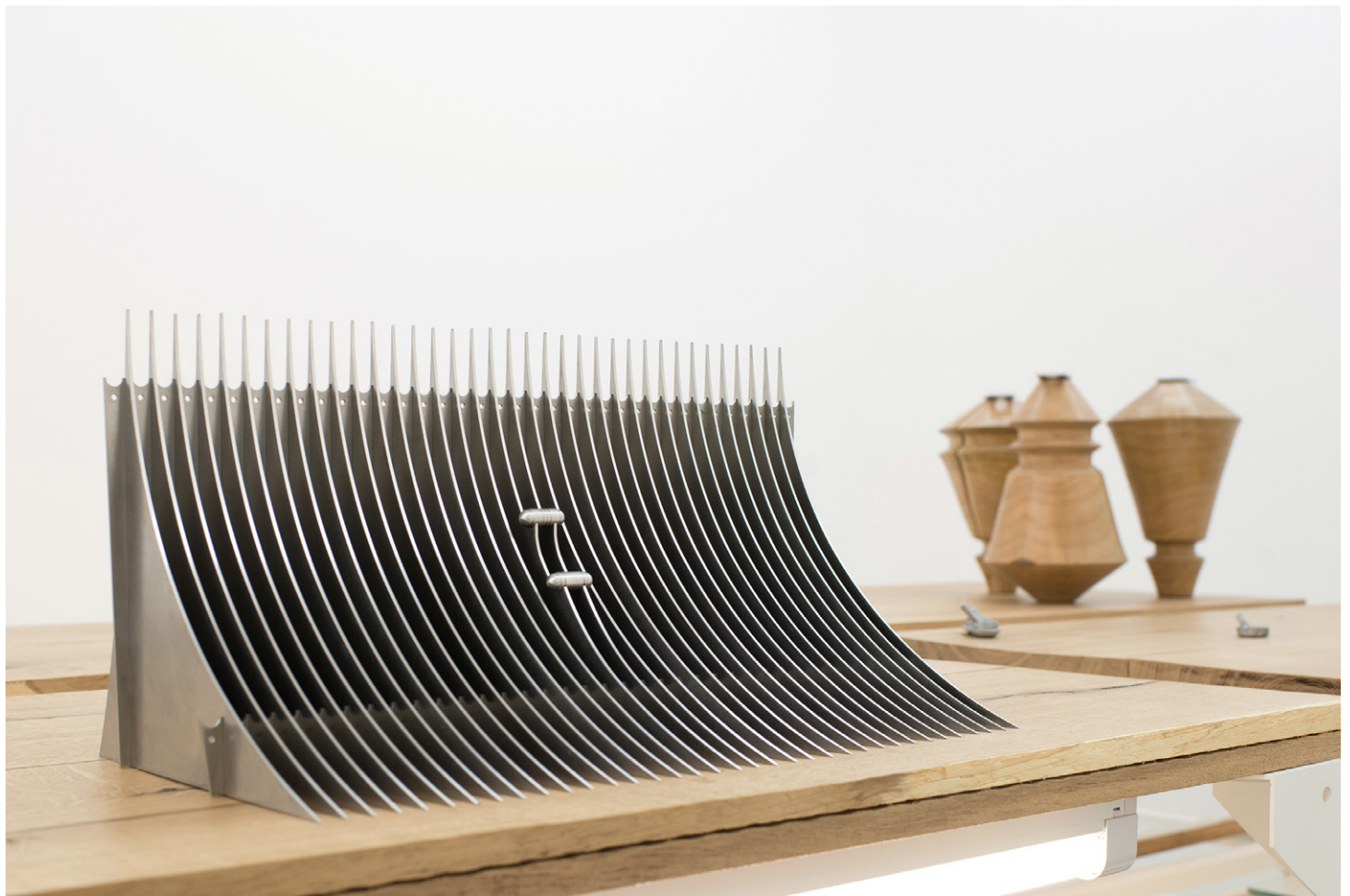
Florian Sumi, Tables d'atelier , 2016 Chêne, Inox, néon / Oak, Stainless steel, oil of tek, neon. 97 x 100 x 60 cm Collection de dessins originaux, impressions sur calques, impression sur papier photographique, vitrophanies, peinture sur papier. Dimensions variables / Variable dimensions