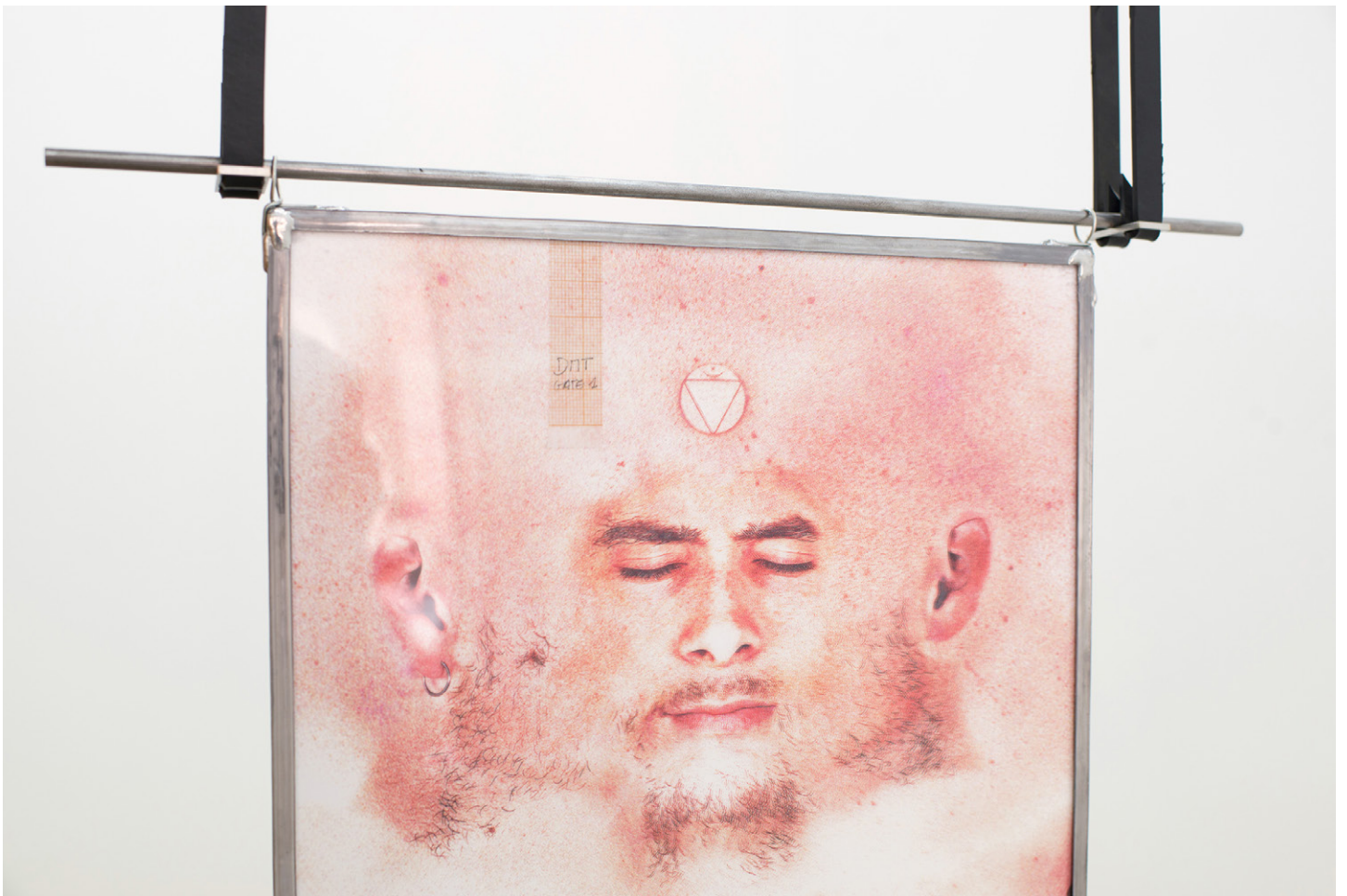
Florian Sumi, Lutrin #1 , 2017. Détails Chêne, Inox, pin huile de tek, vitrophanie, impression sur pvc, plomb chambre à air Oak, stainless steel, pine, oil of tek, print on paper, print on pvc, lead, caoutchouc 256,5 x 120 x 30 cm. Unique