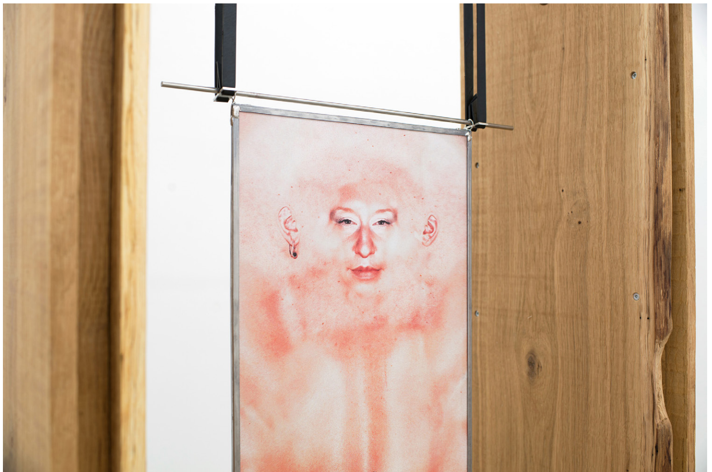
Florian Sumi, Lutrin Double , 2017. Détails Chêne, Inox, pin huile de tek, vitrophanie, impression sur pvc, plomb chambre à air Oak, stainless steel, pine, oil of tek, print on paper, print on pvc, lead, caoutchouc 256,5 x 120 x 30 cm. Unique