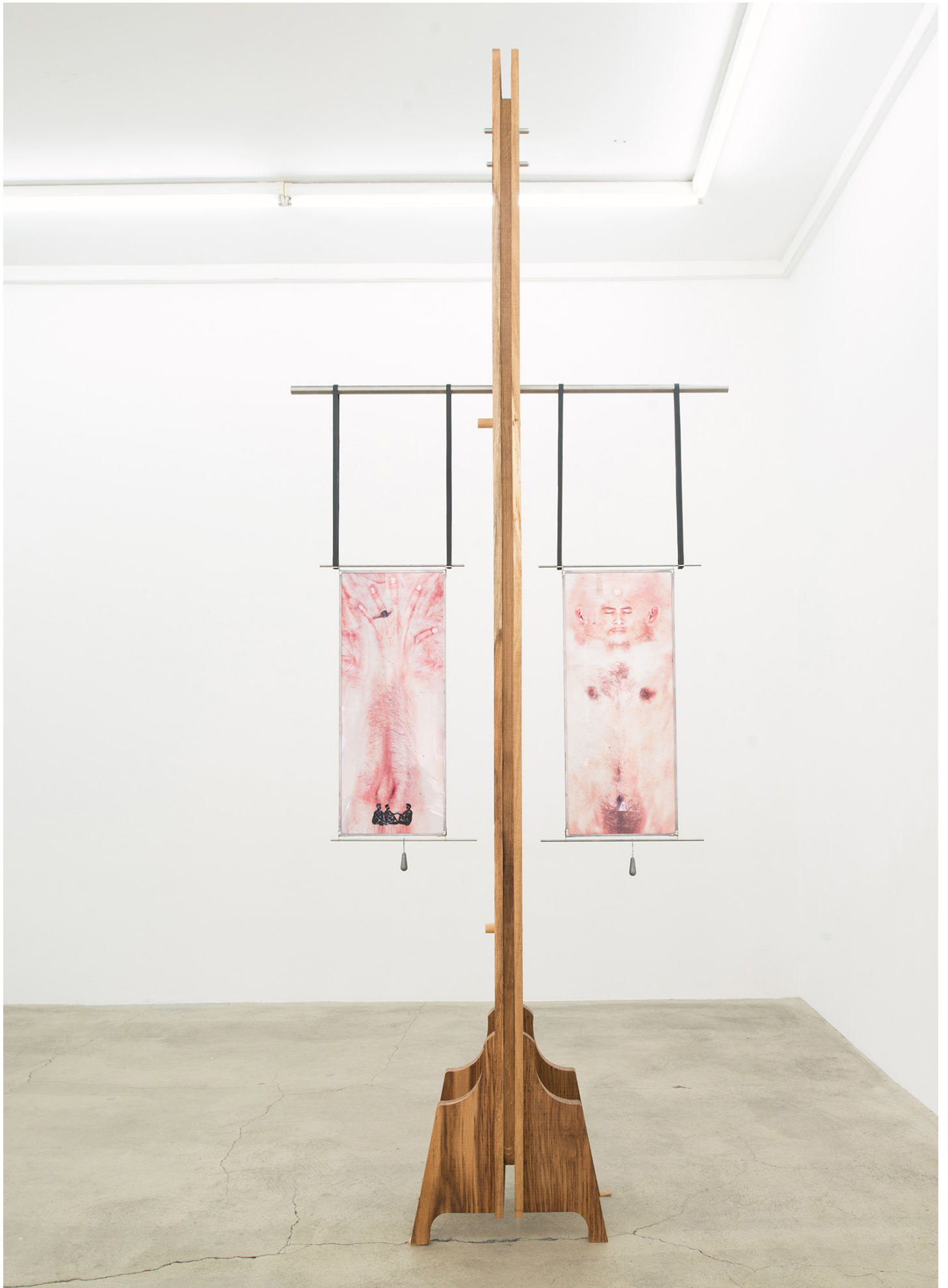
Florian Sumi, Lutrin #1 , 2017 Chêne, Inox, pin huile de tek, vitrophanie, impression sur pvc, plomb chambre à air Oak, stainless steel, pine, oil of tek, print on paper, print on pvc, lead, caoutchouc 256,5 x 120 x 30 cm. Unique