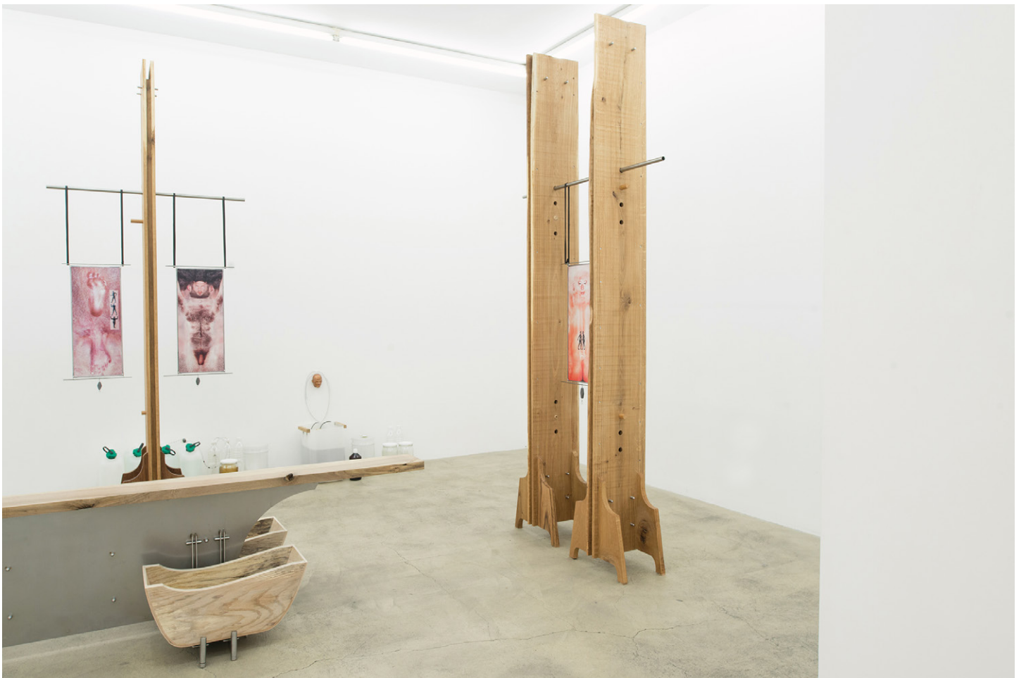
Vue de l'exposition de Florian Sumi / Overview of the exhibition « Florian Sumi : Maître Cœur ». Galerie Escougnou-Cetraro, Paris