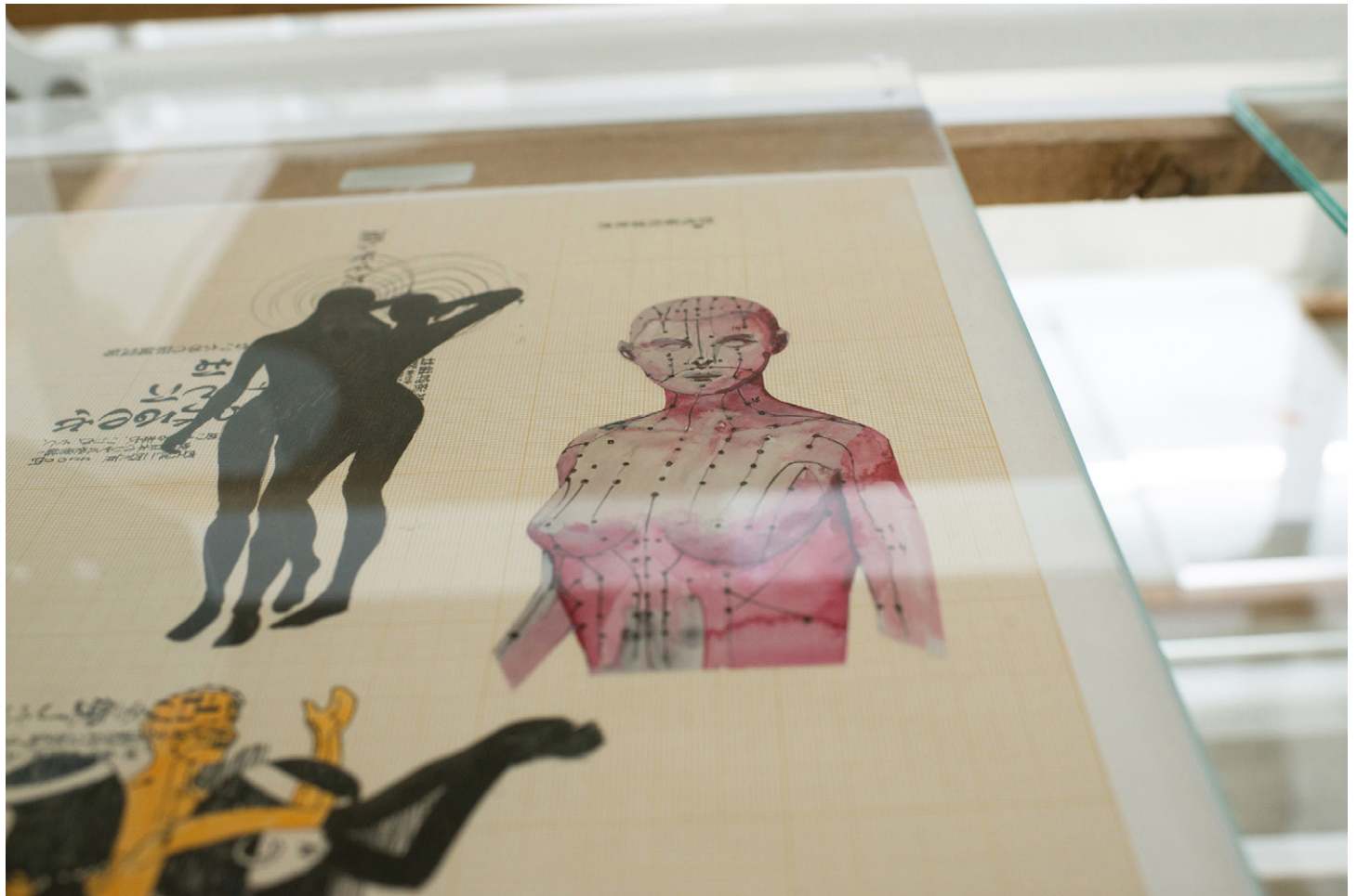
Florian Sumi, Tables d'atelier , 2016. Détail / Detail Chêne, Inox, néon / Oak, Stainless steel, oil of tek, neon. 97 x 100 x 60 cm Collection de dessins originaux, impressions sur calques, impression sur papier photographique, vitrophanies, peinture sur papier. Dimensions variables / Variable dimensions