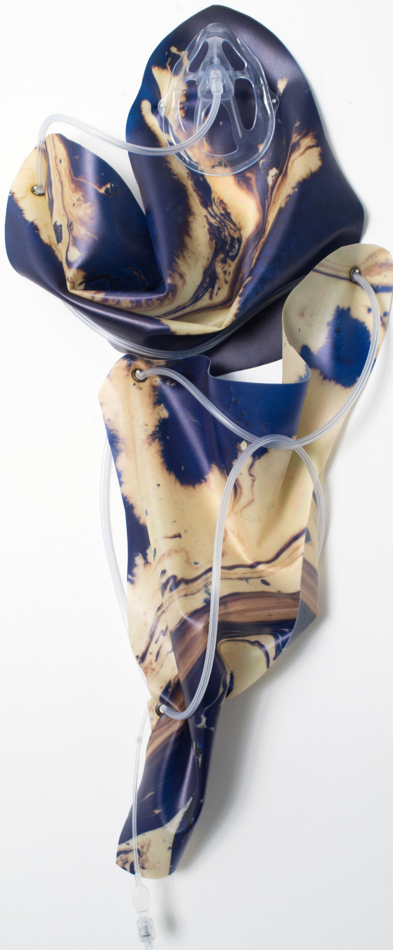
Anouk Kruithof, Petrified Sensibilities 10 , 2017 Impression jet d'encre sur latex, masque d'oxygène, tube d'oxygène / Inkjet print on latex, oxygen mask, oxygen tubing 70 x 32 x 12 cm. Unique