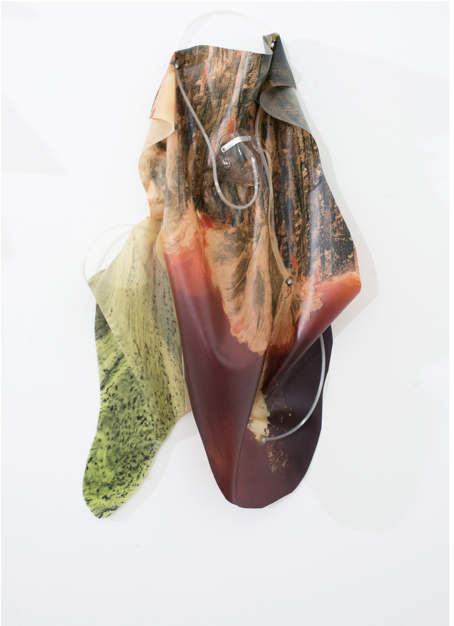
Anouk Kruithof, Petrified Sensibilities 02 , 2017 Impression jet d'encre sur latex, masque d'oxygène, tube d'oxygène / Inkjet print on latex, oxygen mask, oxygen tubing 80 x 40 x 11 cm. Unique