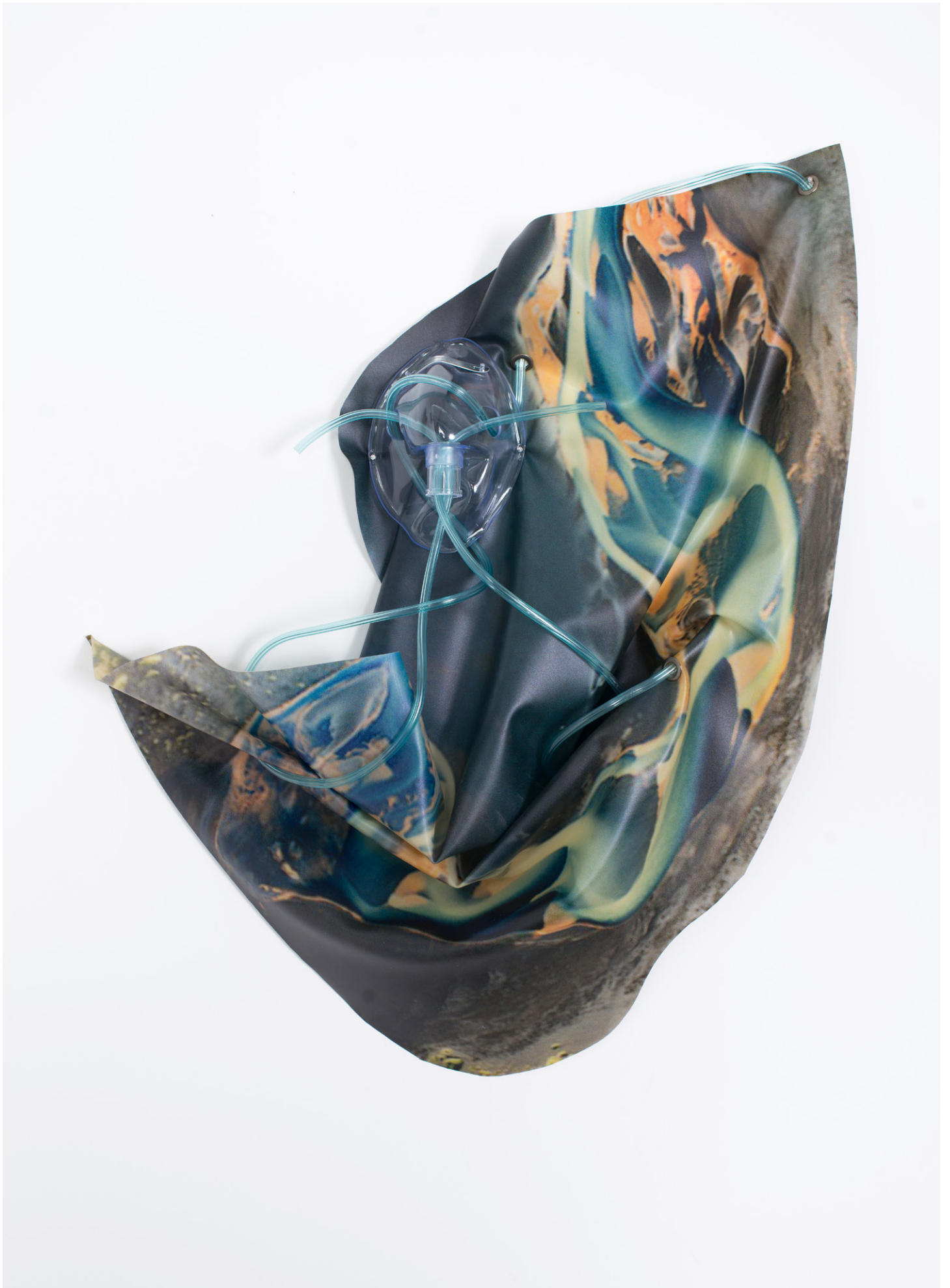
Anouk Kruithof, Petrified Sensibilities 13 , 2017 Impression jet d'encre sur latex, masque d'oxygène, tube d'oxygène / Inkjet print on latex, oxygen mask, oxygen tubing 58 x 46 x 8 cm. Unique