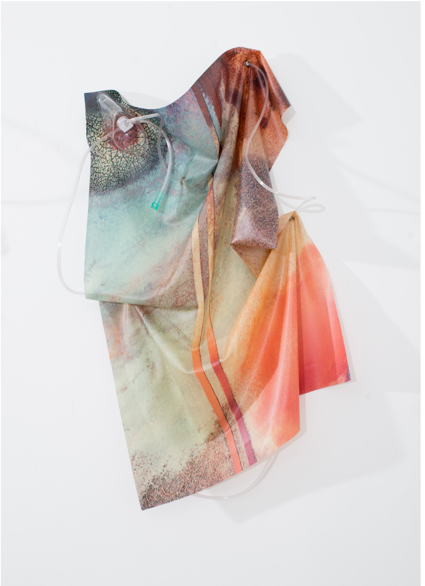
Anouk Kruithof, Petrified Sensibilities 01 , 2017 Impression jet d'encre sur latex, masque d'oxygène, tube d'oxygène / Inkjet print on latex, oxygen mask, oxygen tubing 86 x 50 x 14 cm. Unique