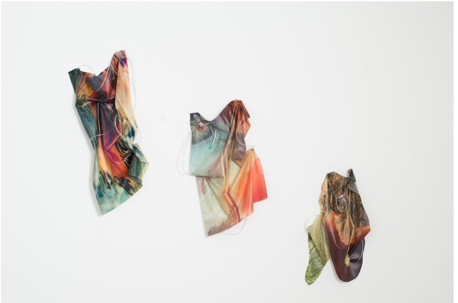
Vue de l'exposition / Overview of exhibition Anouk Kruthof « The Aesthetics of Contamination », Galerie Escougnou-Cetraro, Paris.