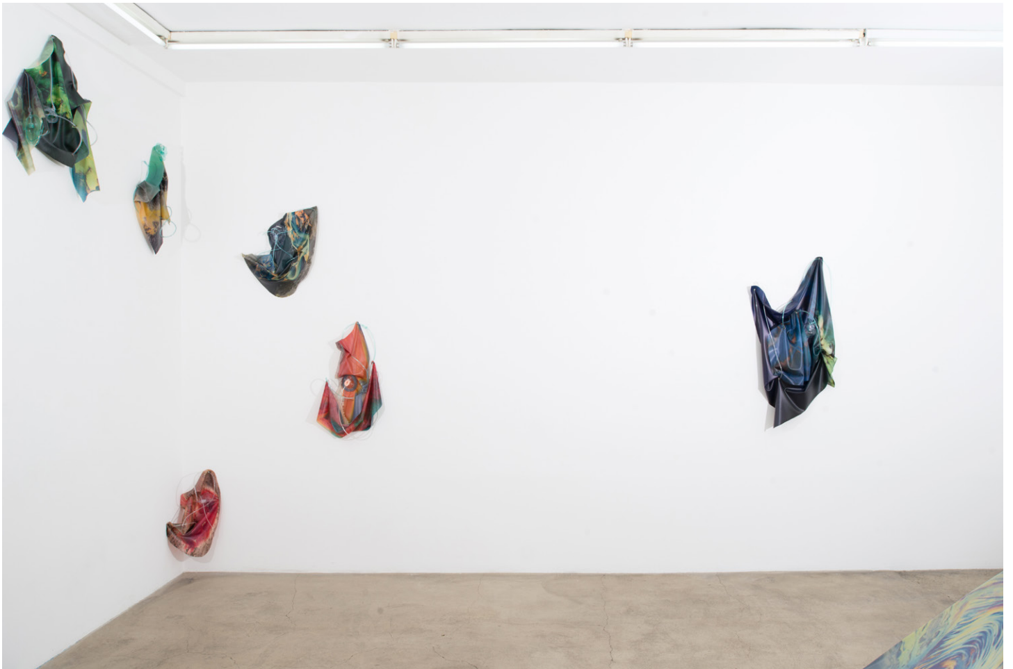
Vue de l'exposition / Overview of exhibition Anouk Kruihof « The Aesthetics of Contamination », Galerie Escougnou-Cetraro, Paris.