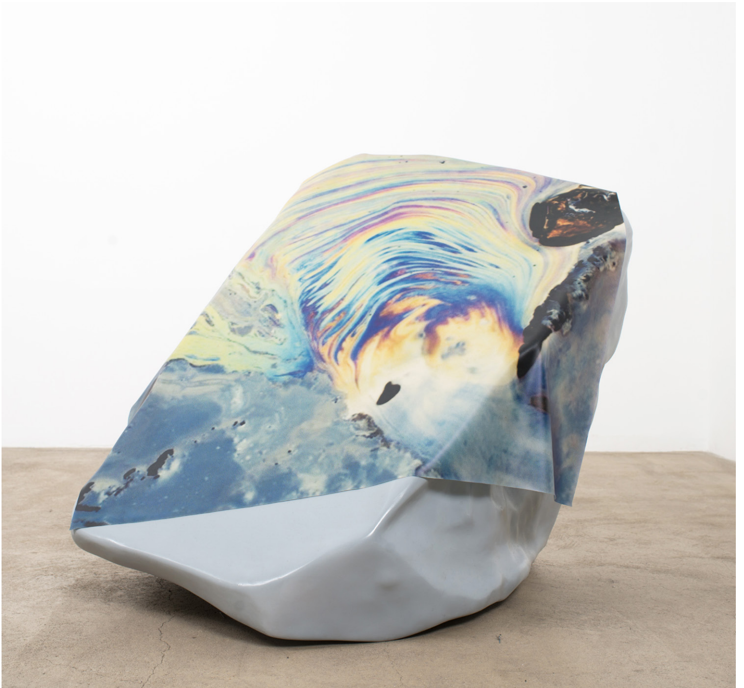
Anouk Kruithof, STONEWALL , 2017 Inkjet print on latex, polystyrene, fiberglass, paint 87 x 89 x 80 cm. Unique