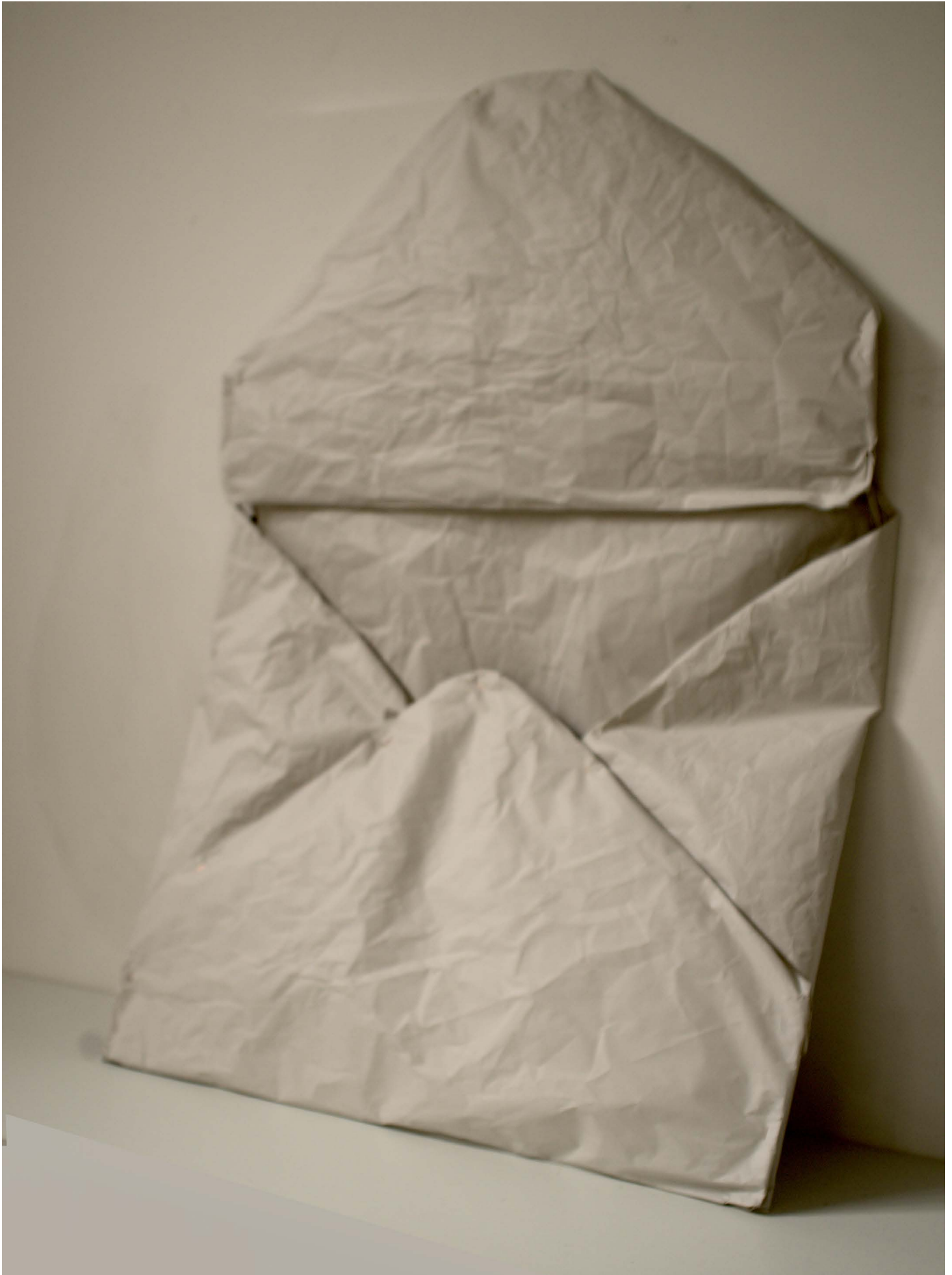
Patrik Pion, L'enveloppe , 2022 Papier journal vierge, agrafes. 125 x 80 x 8cm. Unique